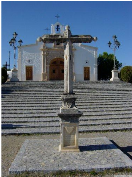
Ermita del Calvario y acceso completamente urbanizado.

La finca del Calvario y todo lo que contiene en su interior es de titularidad pública. Es decir, todos los prieguenses somos propietarios del suelo que pisamos el Viernes Santo con sus chinos, su tierra fértil, su humus y demás