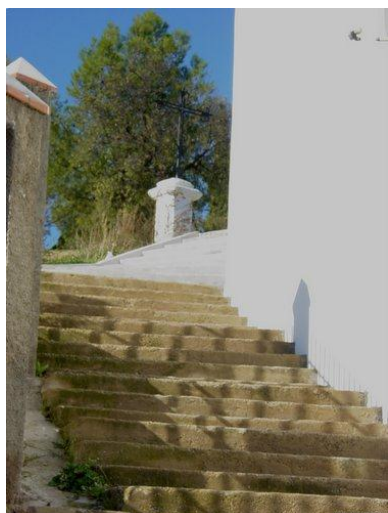
Una de las tantas escaleras que llevan a la cumbre del monte Calvario.