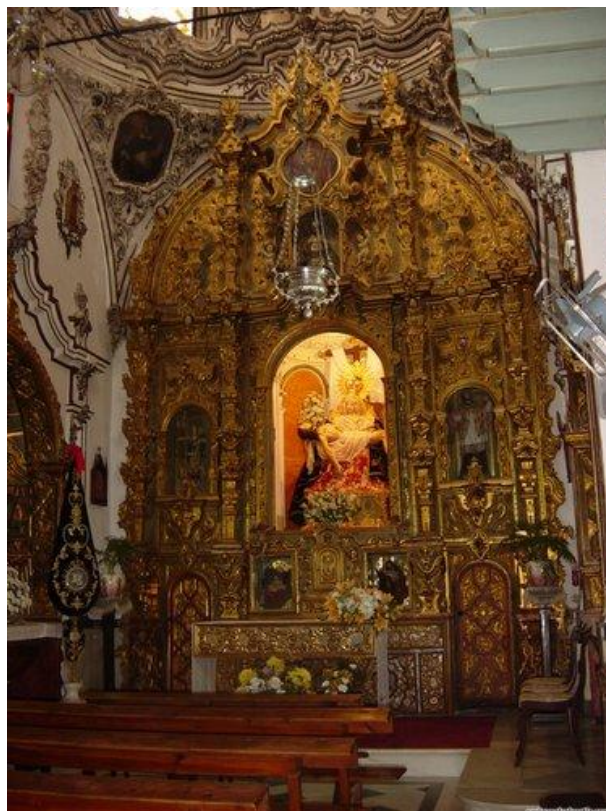
Interior de la ermita de Ntra. Sra. de las Angustias.

En 2002 fue declarada Buen de Interés Cultural por la Junta de Andalucía. Después se recuperaía la espadaña 2 .