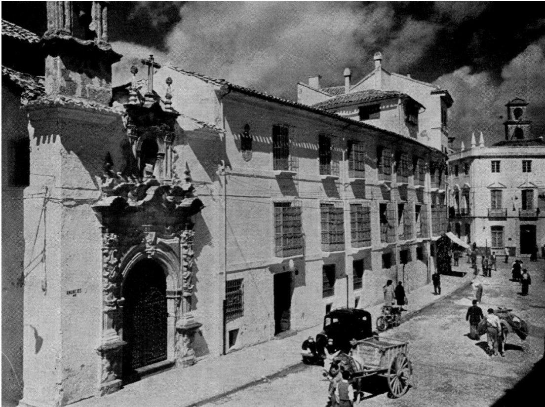
Fachada de la ermita y colegio de Nuestra Señora de las Angustias a mediados del siglo XX.