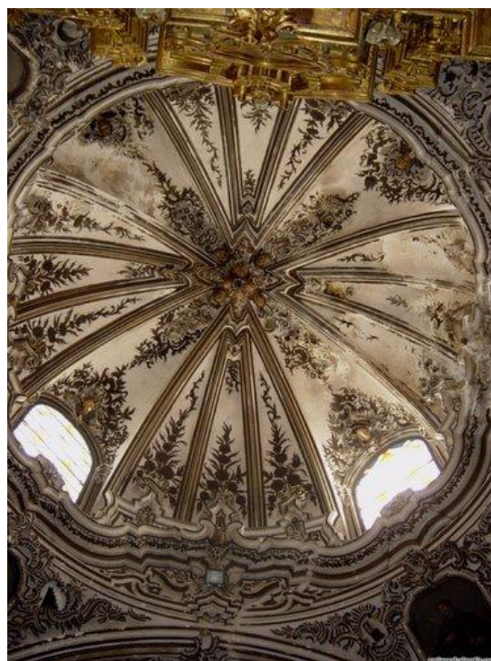
Detalle de la cúpula.