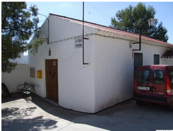
Edificio multiusos de El Poleo.