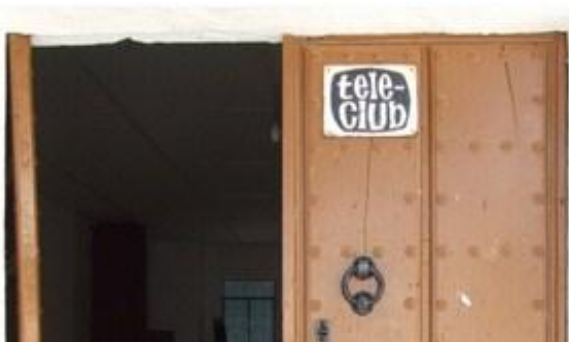
El edificio fue acondicionado para un Teleclub en la década de los años sesenta del siglo XX.

Es propiedad del Ayuntamiento y registrada en el Inventario de Bienes y Derechos con la signatura 1-121-168, con la denominación de “Centro Polivalente y con un valor de 24.040’48 euros. Fue dado de alta el día 1 de enero de 2003. Se incluía por indicación de Antonio Martos Espejo, arquitecto técnico municipal 4 .