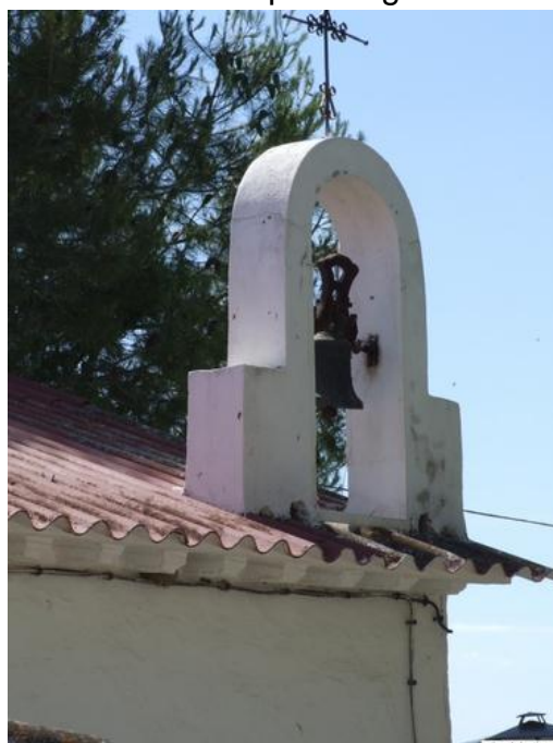
Típica espadaña del edificio multiusos de El Poleo.

En la carretera del Poleo se encuentra la Cruz de Ricardo, sobre unas rocas y bajo una encina. Corresponde a la tipología de pilar. Su fecha de construcción se sitúa alrededor de 1910.