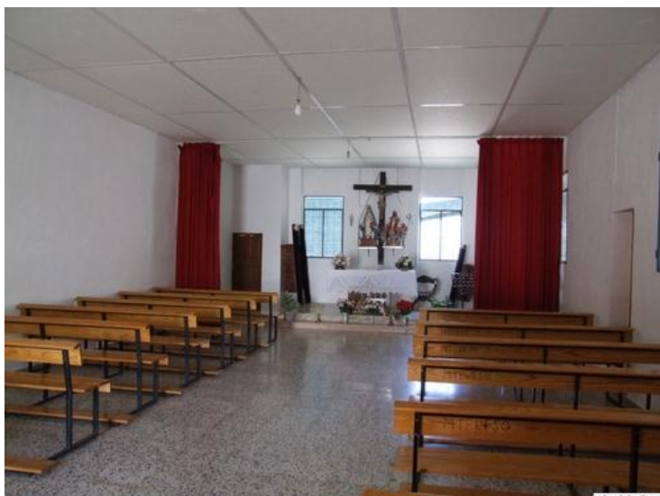
Vista del interior del edificio multiusos de El Poleo.

El cartel turístico que ha colocado el Excmo. Ayuntamiento de Priego nos dice: “Esta aldea cuyo nombre coincide con una planta olorosa de su entorno, no aparece en la documentación hasta el siglo XIX, centuria en la que se conforma y consolida como núcleo rural. D. Niceto Alcalá-Zamora, primer Presidente de la II República, costeó en 1934 la construcción de su lavadero, así como diversas reparaciones en el abrevadero” 1 .