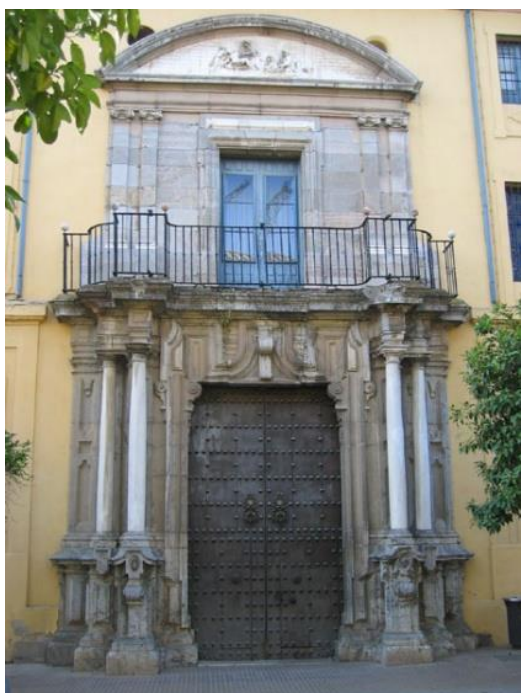
Portada del Seminario Conciliar San Pelagio de Córdoba

Acto continuo se da cuenta detallada con su lectura de los documentos que constan unidos al expediente 903/66 incoado en Secretaría Municipal sobre traslado a esta ciudad del Cristo de la Buena Muerte, el cual se veneraba en la iglesia de Nuestra Señora de la Asunción, y cuya imagen fue desplazada a Córdoba en el año 1965.