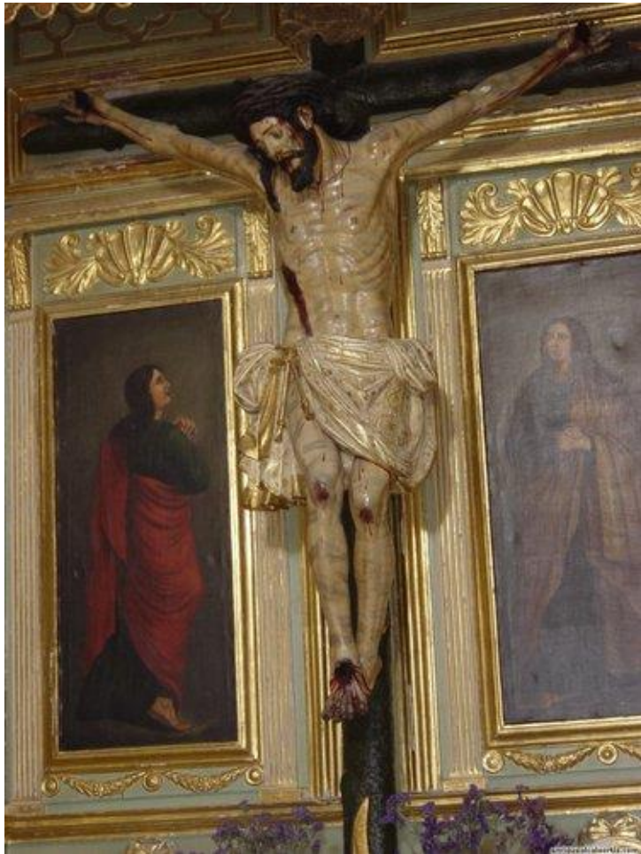
Cristo de los Parrillas en la iglesia de la Asunción de Priego.

S in lugar a dudas, en este caso se cumple el dicho “ que cualquier tiempo pasado fue mejor ”. Fue mejor para los intereses generales del pueblo cuando hay conflicto con las jerarquías eclesiásticas. Cuando surge un trance en el año 1966, con un Ayuntamiento plenamente franquista, todos a una, enseñan los dientes para defender el patrimonio del pueblo frente al obispado. Contrasta esta aptitud cuando medio siglo después, en plena y consolidada democracia, casi la mitad de nuestro concejales (10 de 21) están de acuerdo con el expolio que han llevado a cabo diócesis y algunos patronatos locales. Recordamos, lo más sobresaliente del caso de nuestra historia local.