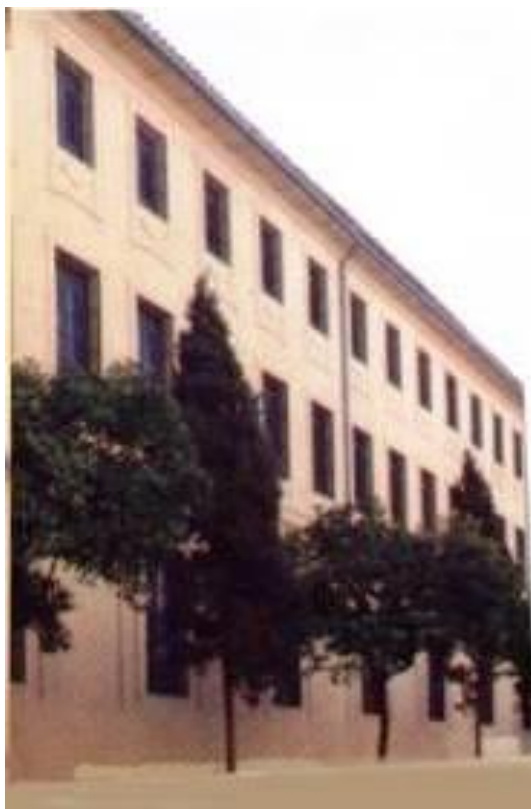
En el seminario estuvo la imagen del Cristo desde enero de 1966 hasta junio de 1967.

Acto continuo se pasó a votación la propuesta sobre la que se resolvía, y cuyas posturas han sido mantenidas aquí por diversos Sres. concejales, y concretadas en que se había la petición de una forma oficial, con todo respeto pero con la energía suficiente como requiere el caso, o por el contrario se hacía de una forma oficiosa, diplomática y con la debida cortesía.