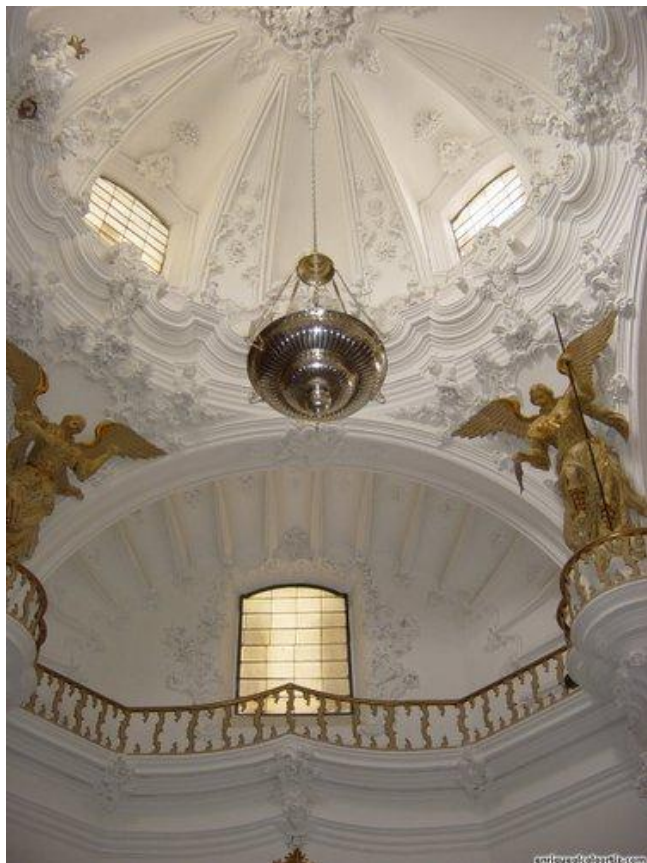
Interior de la iglesia de Ntra. Sra. de las Mercedes, (Foto: E. A. O.)

En cuanto al interior, los parámetros afectados por la humedad y filtraciones fueron picados y resanados, reponiéndose el guarnecido y enlucido de yeso vivo con los elementos desaparecidos. Se repasa y reconstruye toda la rocalla de la nave y de la sacristía, así como la carpintería metálica de las ventanas y los vidrios que faltaban.