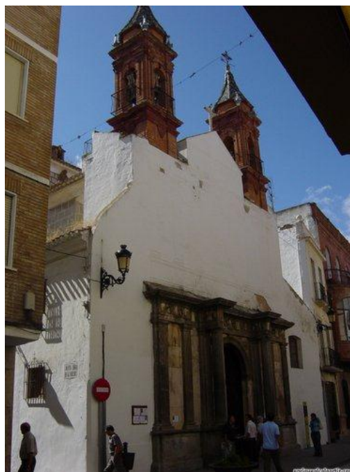
Fachada de la iglesia de Ntra. Sra. de las Mercedes, (Foto: E. A. O.)

Las dos torres, totalmente en ruinas, fueron reforzadas con perfiles metálicos, mientras que las esquinas voladas fueron calzadas con cuñas de acero