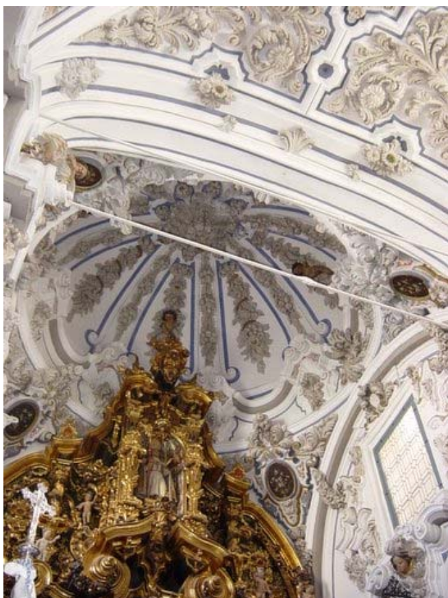
Vista parcial del interior.

Mientras esto sucedía se desprende un sillar de tosco de la espadaña que estaba en ruinas 12 . Y varios años más tarde se desprende una mano de la imagen del pórtico de la ermita 13 .