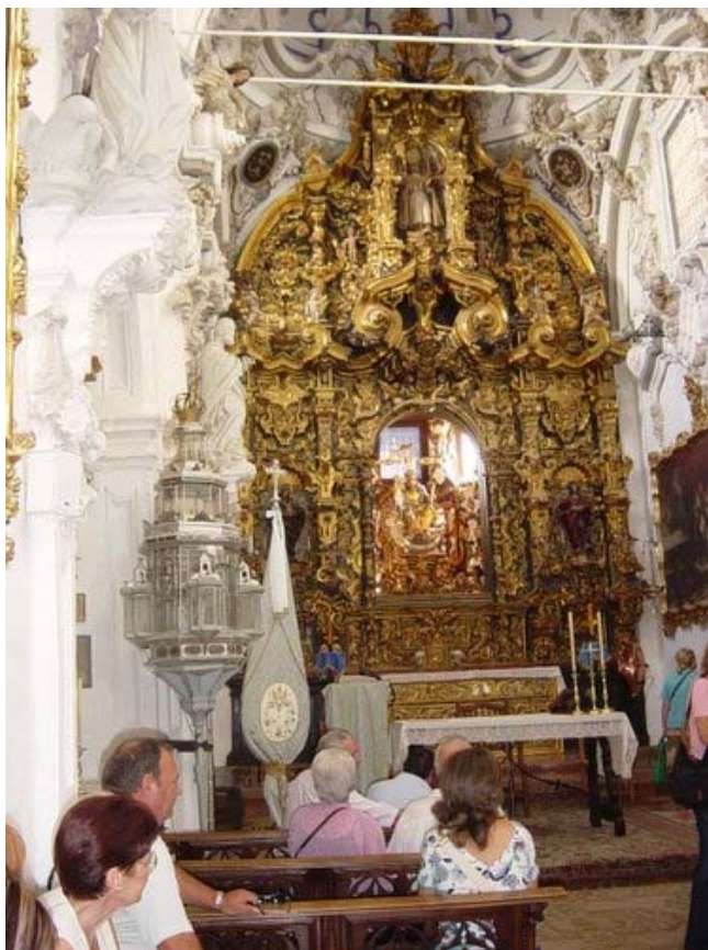
Altar mayor de la ermita de la Aurora.

Durante todo el siglo XX con algunos altibajos, se van sucediendo las directivas y consiguiendo algunos proyectos como la restauración de la imagen de la Virgen, dejando a la vista al estofado primitivo, se estrena un trono de plata obra de A. Carrillo y Vicente Sicilia, se graba un disco con las coplas de la Aurora, se funda una rondalla, se adopta la capa como prenda de vestir, se procura año tras año dar solemnidad a la fiestas y cultos, se proyecta la