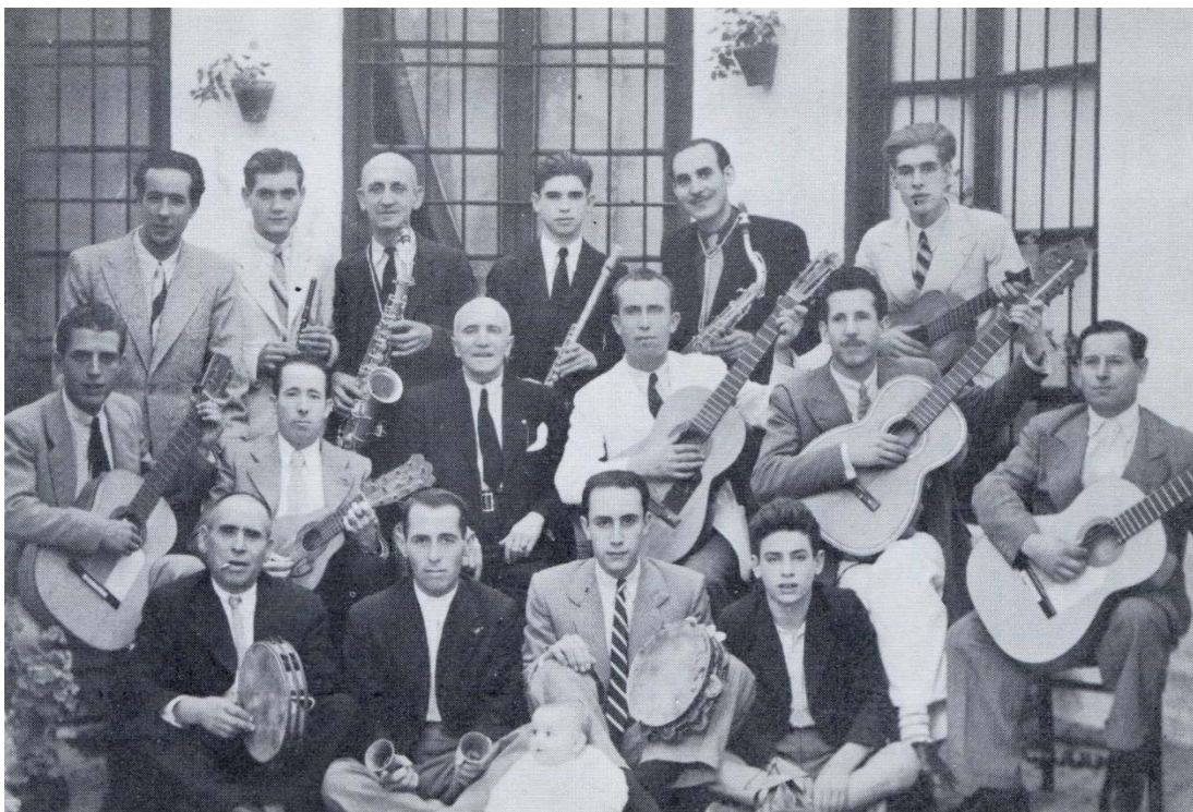
Los hermanos de la Aurora en 1945.

En 1906 se restaura la imagen de la Virgen de la Aurora.