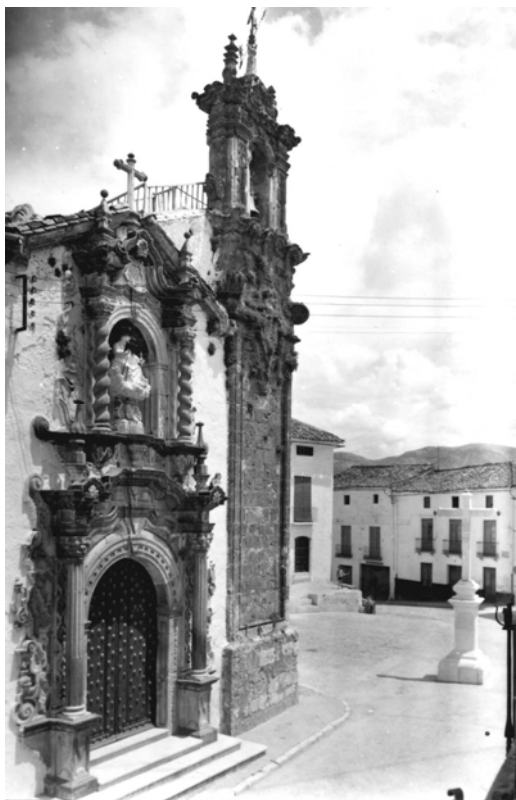
Fachada de la ermita de Ntra. Sra. de la Aurora.

Después de la creación de la Hermandad del Rosario, llamada posteriormente de Nuestra Señora de la Aurora, en 1705, el hermano mayor se desplaza a Granada para encargar una imagen de la Virgen de la Aurora y más