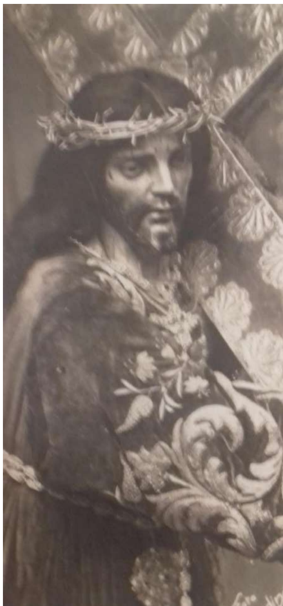
Imagen de Jesús Nazareno. Iglesia de San Francisco de Priego de Priego de Córdoba.