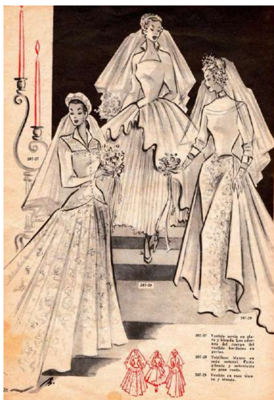
Modelos de trajes de novia. Revista "Mujer" Septiembre, 1954.

Las mujeres vestían vestidos largos, faldas, por debajo de la rodilla, algunos con volantes y fruncidos. Se pintaban los labios de color carmín. Se usaban los trajes de chaqueta con solapas muy marcadas y entallada, y las faldas estrechas que llegaban a media pierna, y abrigos flojos, bolso, y zapatos negros a juego con el bolso. Los cabellos se dejaban largos, y se usaba la laca para los postizos. Estaban de moda los conjuntos de falda y blusa, o, falda y conjunto, que era un jersey y chaqueta de punto del mismo color. Las mangas eran estrechas y largas, o llegaban hasta medio brazo. Cintura muy estrecha, amplitud en los hombros, pecho y falda con mucho vuelo, zapatos de punta.