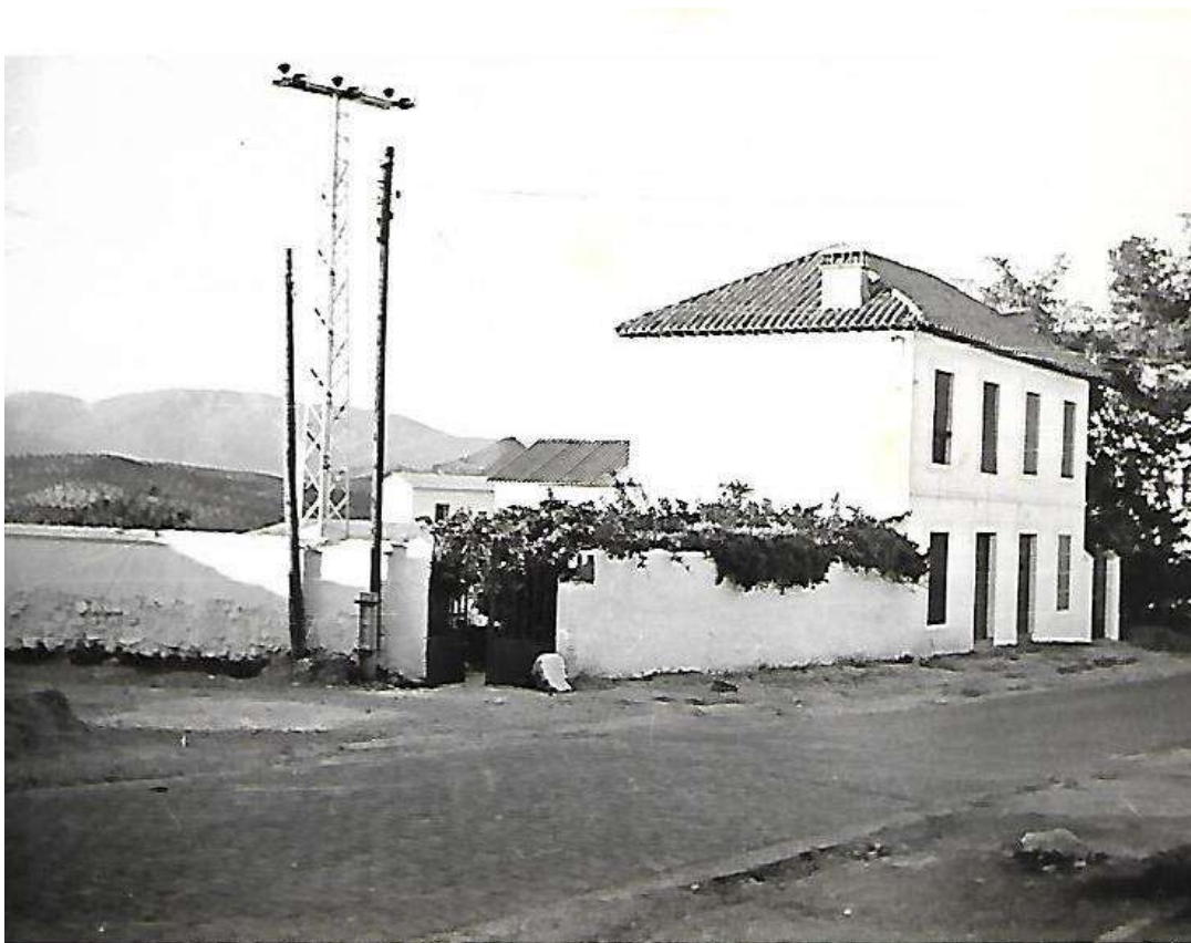
Casa típica, cerca del cuartel de la Guardia Civil. Priego de Córdoba.

Por encima de este bar, en la pared del convento de las carmelitas, se colocaban las carteleras del cine, para conocimiento de la gente. Y sobre ellas, se veían las ventanas del convento.