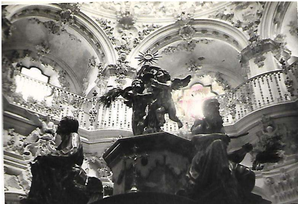
Sagrario de la Asunción de Priego de Córdoba. Vista parcial.

— Y miren lo que decía el Adarve del 5 de junio de 1955: