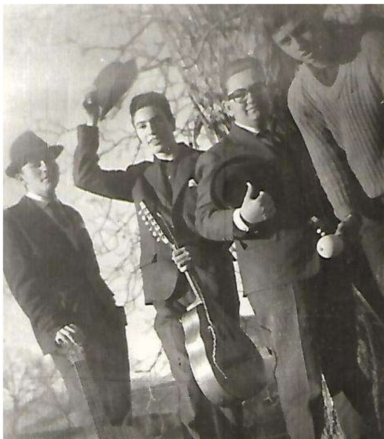
“Los Cuatro X”. primera actuación en marzo de 1959.

Ansiedad, de tenerte en mis brazos Musicando palabras de amor Ansiedad, de tener tus encantos Y en la boca, volverte a besar.