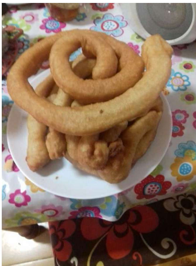
Plato de tejeringsos caseros.