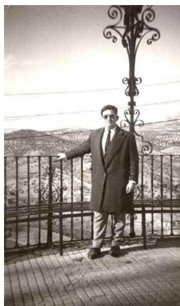
En el Adarve de Priego.

En la Academia del Espíritu Santo, en la calle Montenegro, se estudiaban el Bachillerato elemental y el superior, yendo los alumnos a