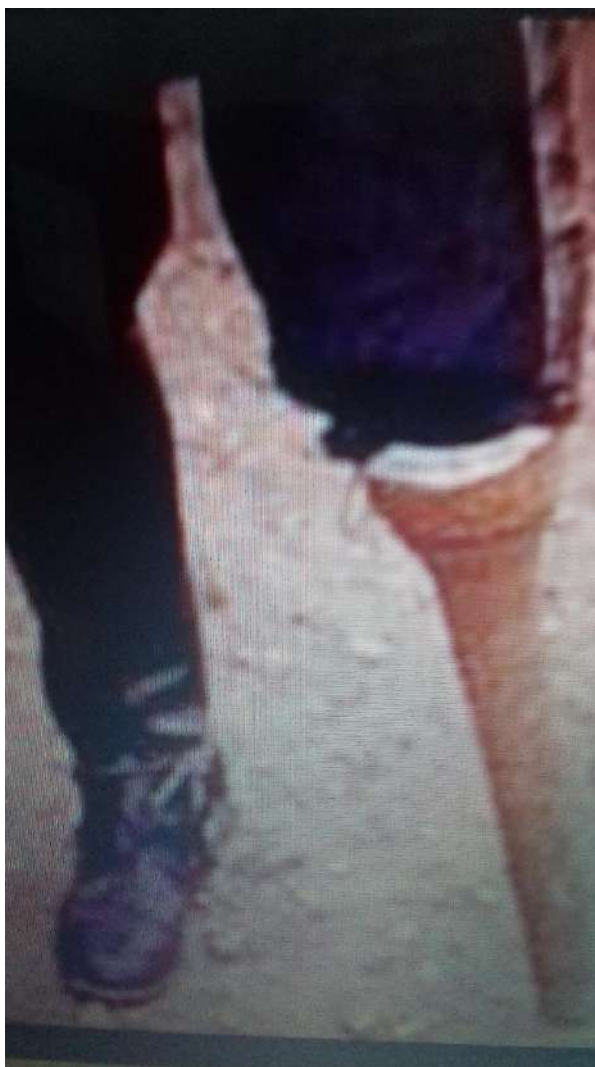
Pata de palo.