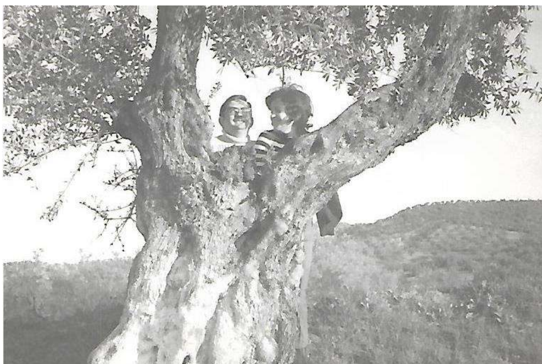
Detrás del olivo centenario.

Otras labores que requerían el cuidado de los olivares, antes de coger las aceitunas, era el corte de varetas, — los tallos de los olivos que salían de los pies de los mismos—, hacer las soleras, — que era aplanar el terreno debajo de los olivos para coger mejor las aceitunas— -, el binado de la tierra que se hacía con la grada, aparato metálico con púas, que arrancaba las malas hierbas.