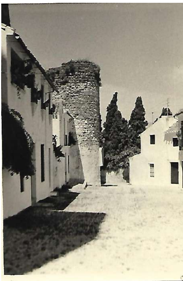
Muralla del castillo de Priego.

Los domingos, por la tarde, la Carrera de las Monjas, era un hormiguero, en el que no cabía un alfiler, porque la gente, paseaba incansablemente, por ella, arriba, abajo, y vuelta a empezar, hasta que llegaban las once de la noche, y se marchaban a casa.