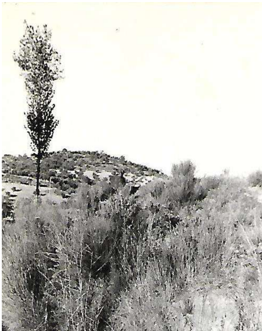
Paraje del río Salado. Priego de Córdoba.

casas grandes de buenas fachadas y rejas bien torneadas a base de fuego y martillo sobre el yunque. Casas de patios grandes bien ventilados, con hermosas fuentes de las que manaba el agua sin parar todo el día con columnas de piedra caliza, cuyos hacedores sudaron en su lucha contra la piedra para ahormarla a unos patrones cilíndricos determinados.