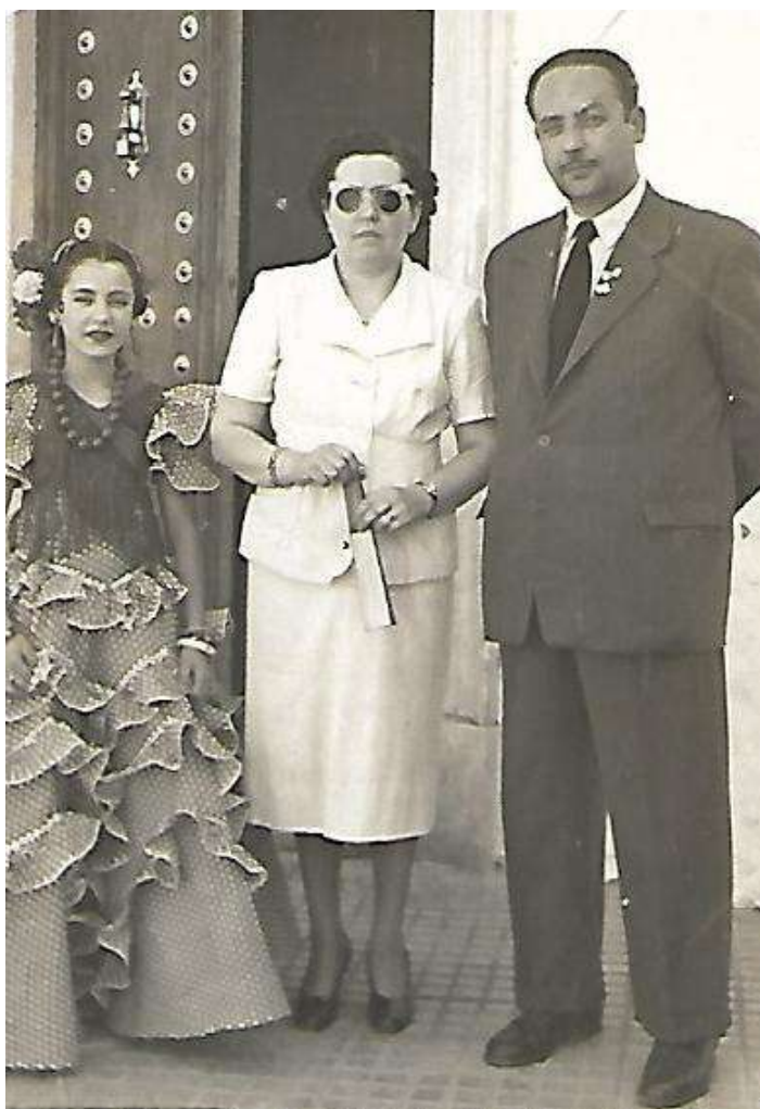
Los padres y su hermana van a la feria.

Los días fuertes de feria no había trabajo en el taller de Felipe, pero acabada ésta, se volvía al ruido de las máquinas y los golpes de los martillos en el yunque, después de sacar la pieza al rojo vivo de la fragua.