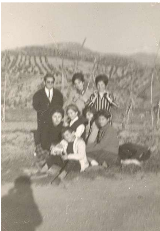
Con un grupo de amigos.

No sabemos cómo aquel sitio tan pequeño, podía guardar tanta cosa tan rica.