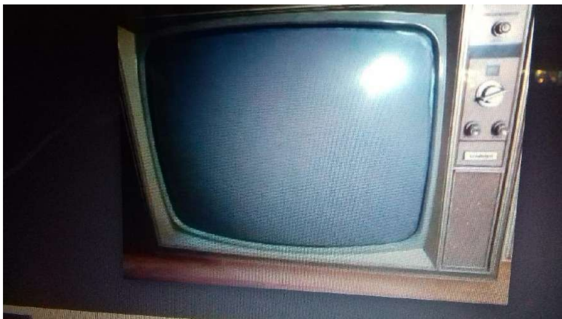
Uno de los primeros modelos de aparatos de T.V.

El aplauso al Cordobés, valiente donde los haya, es unánime, y éste, con singular maestría, le coloca al toro, frente al banderillero, que, con un salto, le pone un par en mitad del lomo, con el aplauso del respetable.