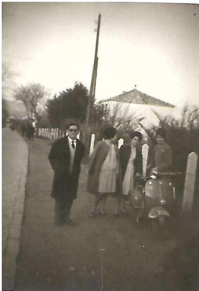
Grupo de amigos con moto Vespa.