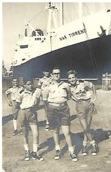
En el puerto de Cádiz. los

Se escuchaban pocas emisoras en la onda media, destacando RNE que era la que emitía el parte cada día a las dos de la tarde. Más tarde apareció Radio Cabra, que tenía la antena en la Sierra de Cabra, a más de mil metros de altura, oyéndose en muchos lugares. Pronto se hizo muy popular entre oyentes.