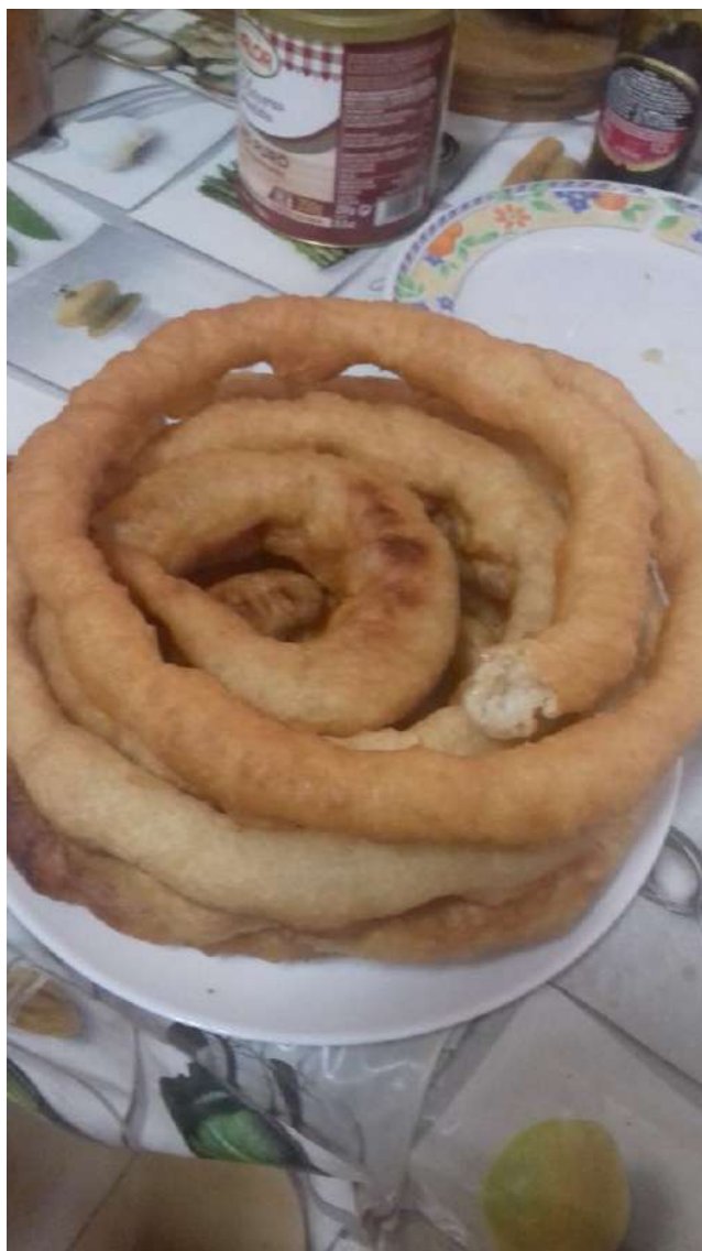
Rueda de tejerings al estilo antiguo.

ajos, machacados, para que el aceite de aceituna picuda cogiera su sabor.