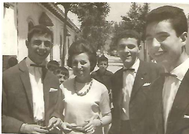
El conjunto “Las Cuatro X” en Cabra (Córdoba)

En la onda corta, se cogían bastantes emisoras, y entre ellas, destacaban Radio Holanda, la BBC, y La Pirenaica, que transmitía desde Moscú noticias para España. Era una radio prohibida.