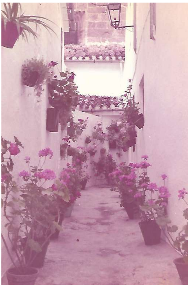
Calleja del barrio de la Villa. Priego de Córdoba.

Había bancos, al principio de la calle; uno era el banco Central, debajo del cual, se encontraba la tienda de Los Chiquillos. En este banco, había corredor de comercio, para realizar las operaciones que se presentaran.