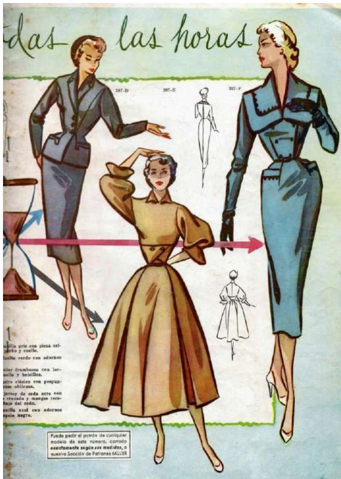
Revista "Mujer" Septiembre, 1954.

Lista de precios. Enviando las medidas, la revista realizaba por encargo los patrones de cualquiera de los modelos que aparecían en ella.