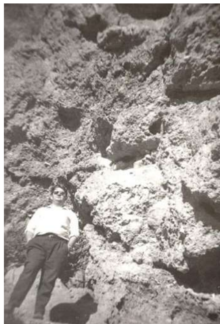
Bajo el Adarve