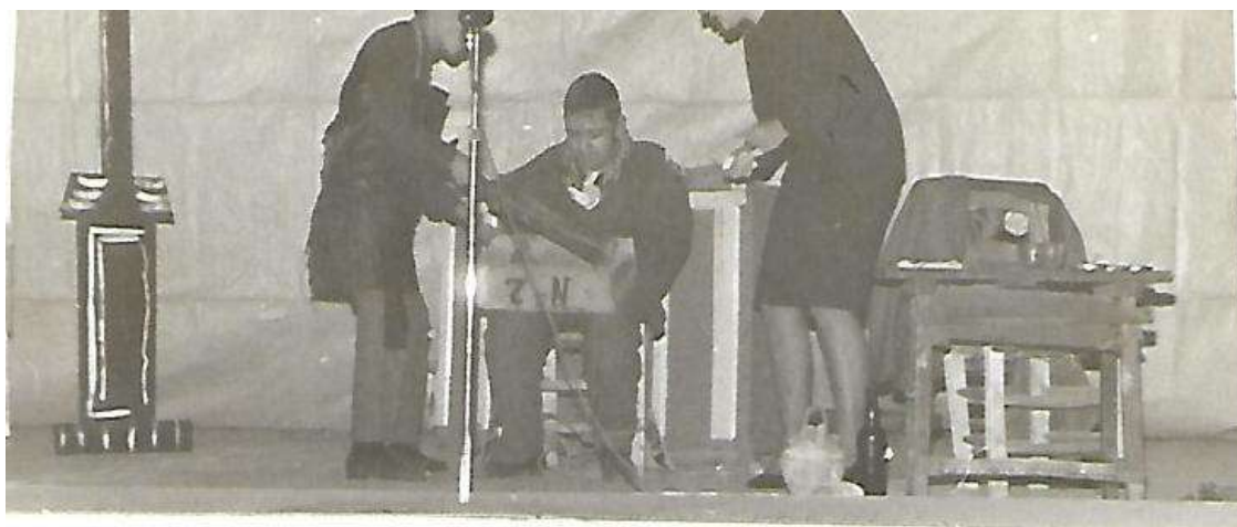
Función de teatro de los alumnos de la Academia del Espíritu Santo en el Teatro Gran Capitán.

La gente moría en sus casas, y a lo sumo, en el hospital de San Juan de Dios, y tras la muerte, se preparaba una habitación, donde se dejaba el cadáver, metido en su caja, hasta la hora del funeral. Unas veces, la caja estaba tapada, y otras, los dolientes que iban a ver al fallecido, destapaban la caja para verlo.