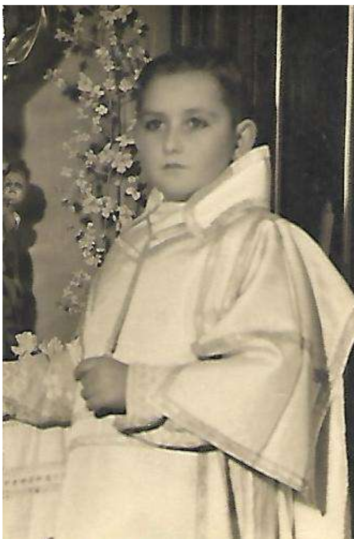
Cayetano de monaguillo.

Trozos de ramas sanas, y de tamaño mediano, se cortaban, viendo que tuvieran yemas, que, en contacto con la humedad de la tierra, harían brotar un nuevo olivo, al año siguiente. Para ello, se