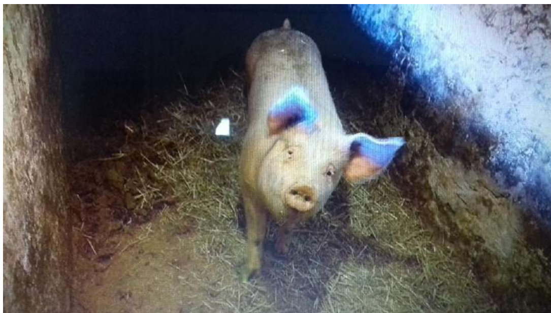
Cerdo preparado para su sacrificio matancero.

— Buenos días señores. Todavía no han llegado los que tienen que traer los dos cochinos. Pasad y tomad una copita de aguardiente de Rute para matar el “gusanillo”.