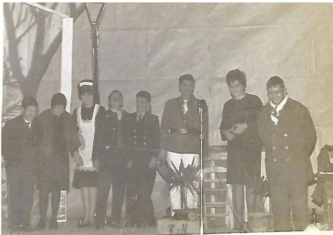
Función de teatro de los alumnos de la Academia del Espíritu Santo en el Teatro Gran Capitán.

Fue muy sentida la muerte de un devoto de Jesús de la Columna, que se pegó un tiro en la tumba de su padre en el cementerio, durando su agonía varios días.