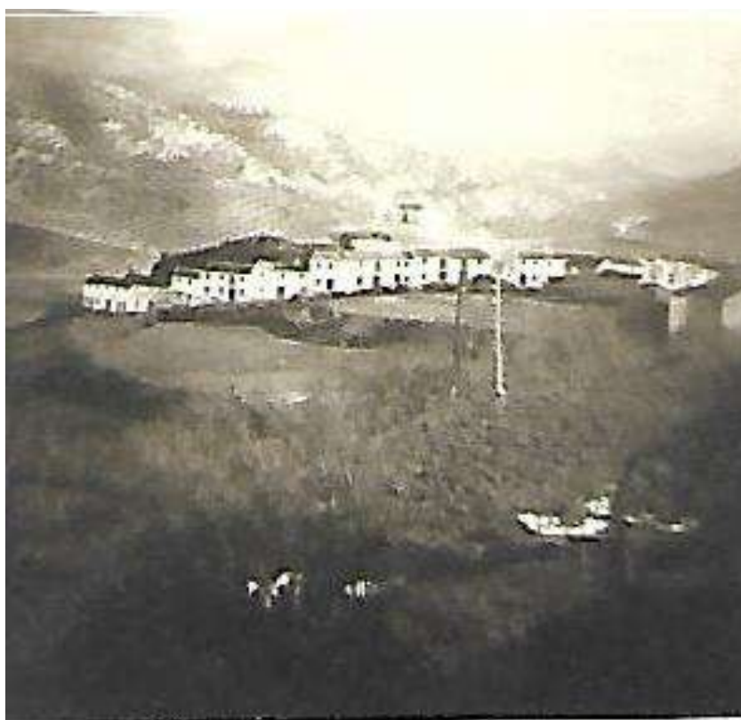
Panorámica de la Cuesta del Salado. Priego de Córdoba.

En las afueras del pueblo había una gasolinera moderna cuyos surtidores funcionaban a luz. Con veinticinco pesetas tenías combustible para hacer unos pocos de kilómetros. La gasolina por aquel entonces, costaba a 9.75 pesetas el litro, y los coches, solían gastar uno 8 litros de promedio a los cien, aunque si hacías como algunos, el consumo era más reducido: