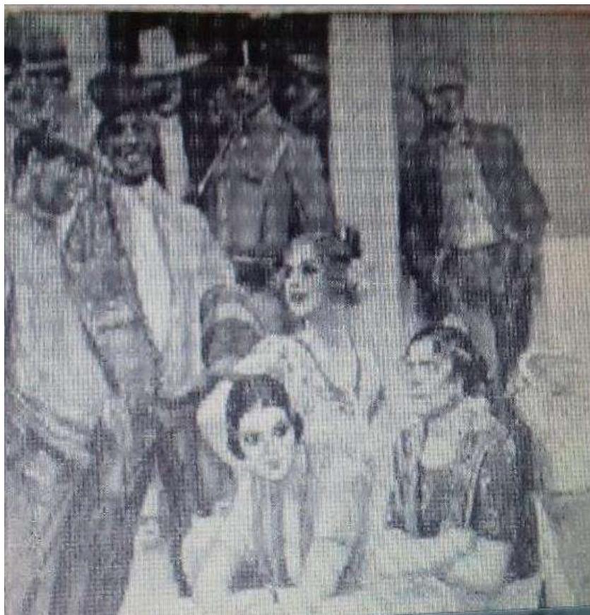
Cartel de Feria. Obra de Adolfo Lozano Sidro.

Sobre el escenario actuaban cantantes de prestigio, y orquestas de renombre, sobre todo, por la noche.