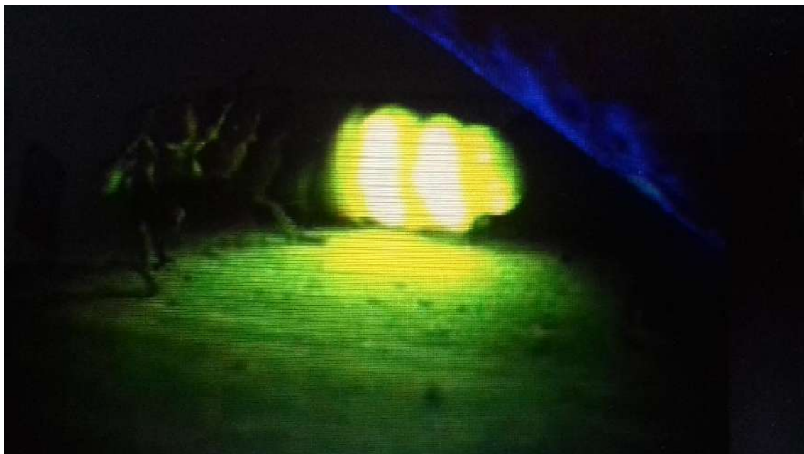
Luciérnaga de luz.

y que, en la cocina, troceadas, conformarían la ensalada, o, cubiertas con agua, aceite, sal y vinagre, formarían el gazpacho de jeringuilla que se comía por todos los miembros de la unidad familiar, dentro de la misma fuente.