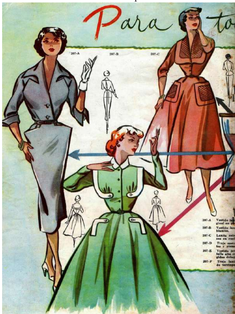
Revista "Mujer" Septiembre, 1954.