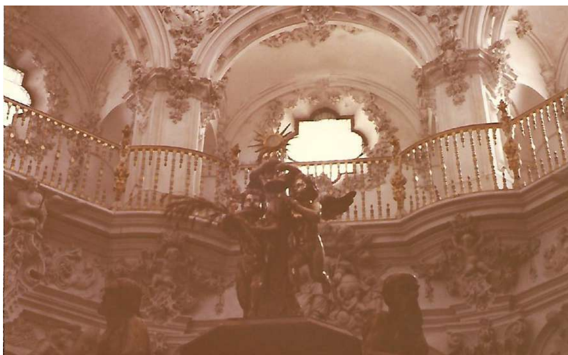
Sagrario de la iglesia de la Asunción de Priego. Vista parcial.

El día anterior a la celebración de la misa festiva en San Francisco, o, sea, el sábado, a eso del mediodía, la una de la tarde, se tiraban cohetes para recordar a la gente la fiesta de mañana.