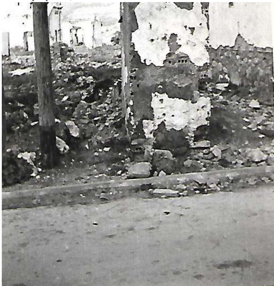
Barrio de Jesús Nazareno, popularmente Casa Baratas, en estado de ruinas