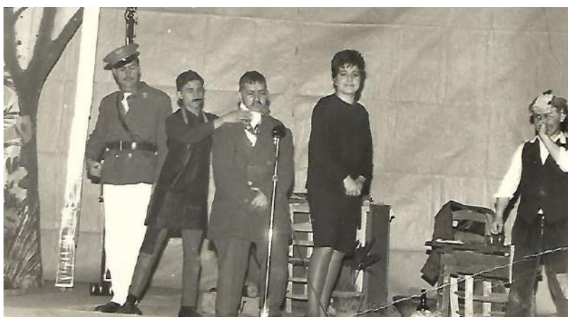
Función de teatro de los alumnos de la Academia del Espíritu Santo.

puede sobre la carretera, que en época de tormentas, casi se cegaban los ojos, con el peligro de que el agua se llevara todo, al taponarse los ojos con ramas y troncos de las alamedas cercanas. Allí se fabricó un gran chalé, para disfrute