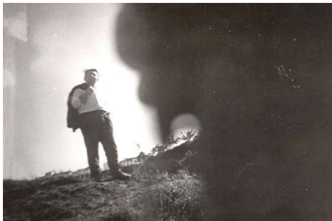
Bajo el Adarve de Priego.

Los tres párrocos de las tres iglesias más importantes, velaron con gran interés por sus iglesias, acometiendo obras de reforma en ellas, y adaptándolas a lo exigido por el Concilio Vaticano II.