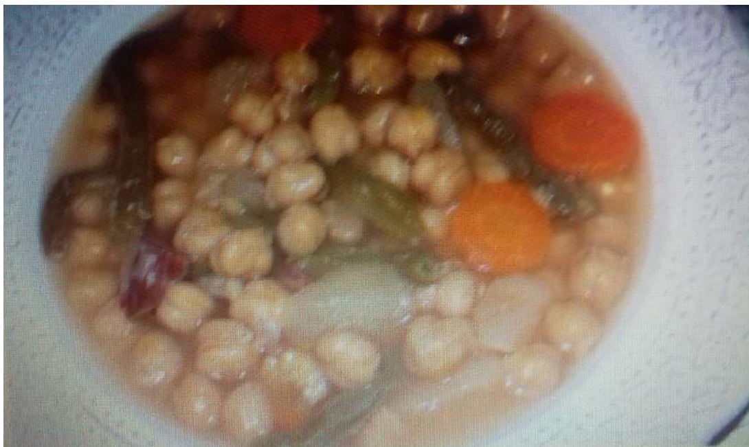
El típico cocido.

Después se dejaban escurrir en el platero, secándose con un paño de cocina, después.