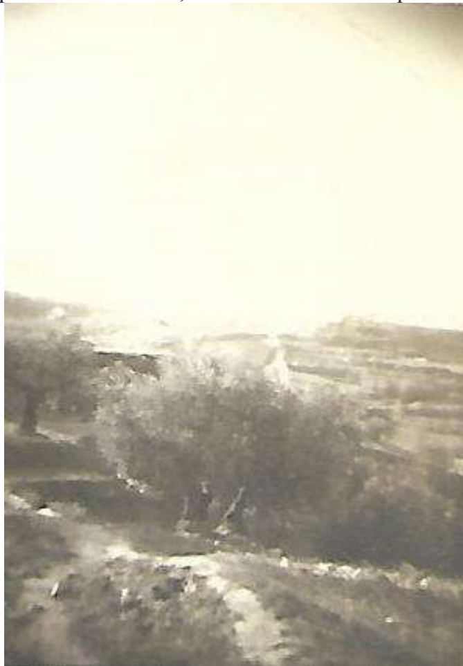
Vereilla de Priego