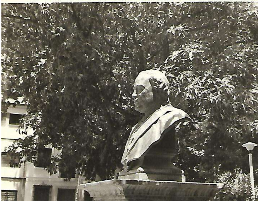
Busto del Obispo Caballero en el Paseo de Colombia de Priego de Córdoba.

Y la gente, al pasar por la puerta de la joyería de la Carrera de las Monjas, se paraba a ver las joyas que se exponían en el pequeño escaparate del local, también relojes. Pero no era tampoco el momento más oportuno para detenerse, porque la gente, dada su aglomeración, podía tirarte al suelo. Y había, que andar y andar, sintiendo en la cara, el fresco de la noche, que amenazaba con helar.