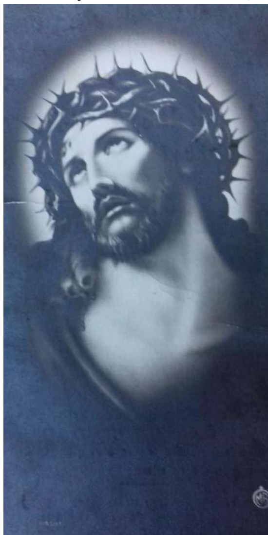
Cristo en la cruz.

En una máquina grande, que tenía un embudo en lo alto, la picadora, le iban echando la carne, y con una manivela, que tenía un tornillo sin fin, iban dando vueltas a la vez que por el otro lado, la carne entraba en la tripa, llenándola y atándola después.