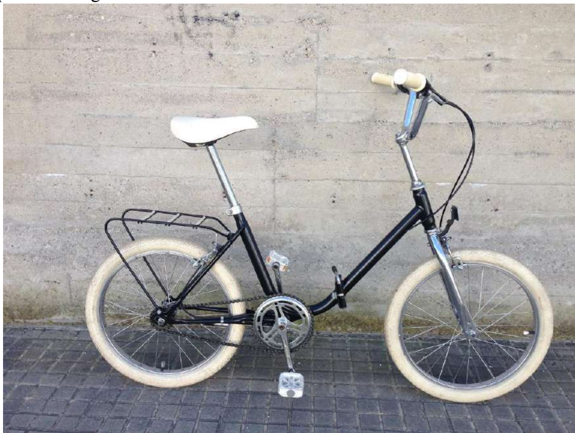
Bicicleta de Mari.

Al llegar la alsina al pueblo de Puerto Lope, el conductor paró para recibir instrucciones de la compañía, la que le ordenó que trasladara todo el pasaje a otra alsina averiada que iba a Córdoba y que debía volver a Granada para ser arreglada.