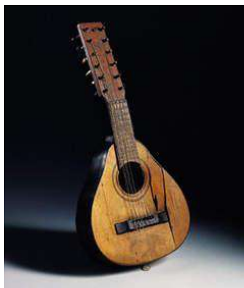
Mi vieja bandurria.

Aunque amores yo tenga en la vida, Que me llenen de felicidad, Como el tuyo jamás, madre mía, Como el tuyo no habré de encontrar. Madrecita del alma querida, En mi pecho yo llevo una flor, No te importe el color que ella tenga, Porque al fin tú eres madre una flor.