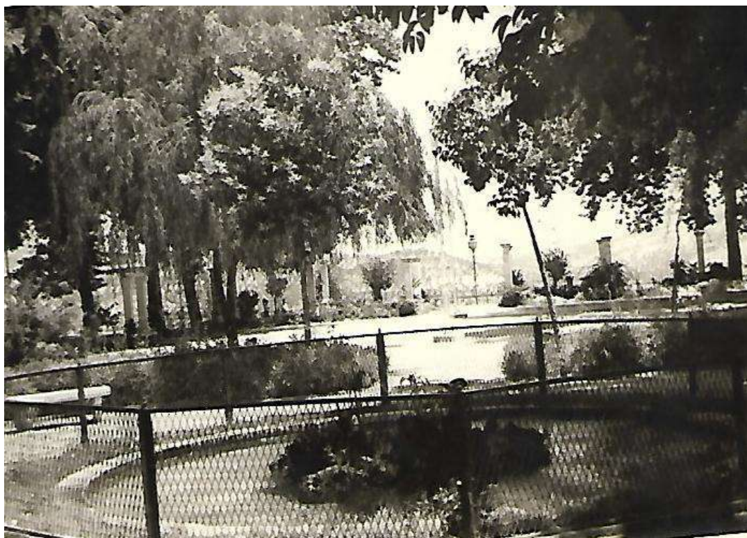
Fuente en el Paseo de Colombia. Priego de Córdoba.

Y en los balcones del Adarve, los abuelos que buscaban el fresco que venía de las sierras, no pudiendo aguantar aquellas melodías cantadas, y acompañadas con el clásico instrumento, ponían pie en polvorosa, alejando el paso de la casa de las canciones, buscando la salida hacia la Villa, lástima que allí no hubiera bancos de hierro para poder sentarse.