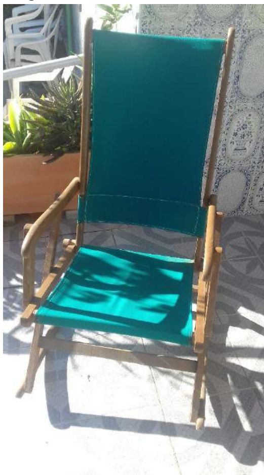
Hamaca de los años sesenta para descansar del ajetreo de la feria.