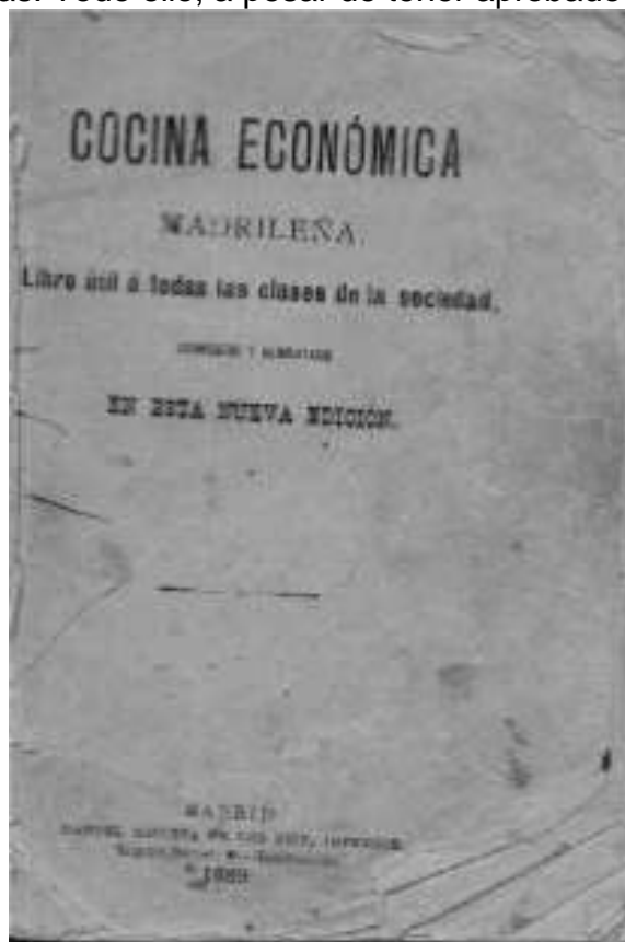
Portada de libro antiguo de cocina. 1889.

Por el año 1900, aparece por primera vez en las actas municipales un escrito en el que se hace referencia a los metros cuadrados referidos a la ampliación de un terreno para construir un panteón familiar, aunque simultanea esta medida con las fanegas y las varas. Todo ello, a pesar de tener aprobado el Sistema Métrico. Será a finales del año 1914 2 cuando se lee un oficio en el pleno de la Corporación del Ingeniero Fiel de la provincia en el que se daban las normas para implantar de una manera definitiva el Sistema Métrico Decimal. Así se conviene, y se publican edictos dando a conocer el acuerdo, invitándose a comerciantes e industriales para que lo cumplan. Un sistema casi implantado actualmente, pero que se resiste a entrar en algunas parcelas donde aún se emplean las medidas antiguas. Así, las fincas rústicas, se venden por fanegas; los cerdos se pesan por arrobas y el aceite y el vino se miden en esta misma medida cuando es vendido en cántaras, incluso todavía, muchas amas de casa ponen a sus hijos por merienda un bocadillo (antes se llamaba "joyo") con unas onzas de turrolate.