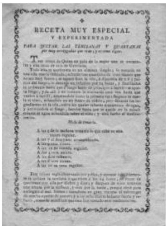
Receta para quitar las fiebres tercianas y cuartanas.

Se parte, se echa en la olla con agua y sal, da algunos hervores, se le vacía el agua, se tuesta el aceite con bastantes ruedas de ajos, perejil, especias finas y su agrio de limón y poco caldo.