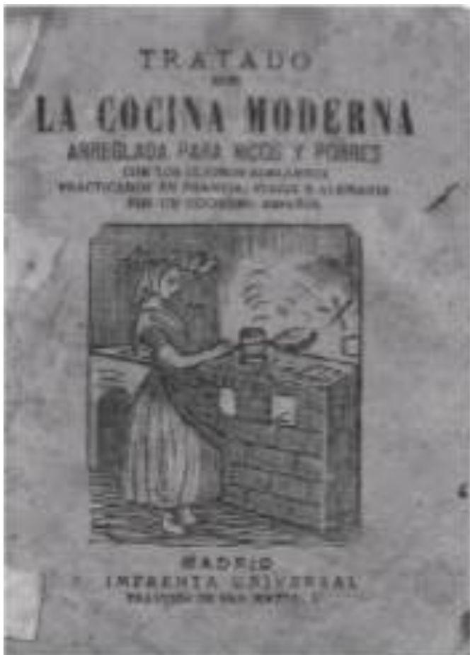
Portada de libro antiguo de cocina. Imprenta Universal. Madrid.

Para sus dulces acostumbra a poner hasta cincuenta veces los huevos y once el pan y la leche. Acostumbrada ésta, además, como plato en la leche frita.