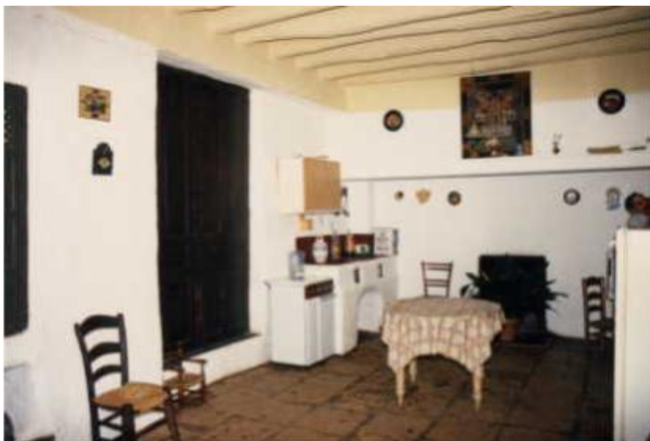
Cocina antigua. La Ginesa. Priego de Córdoba.

Veamos cómo empieza una de sus recetas para darnos cuenta cabal de este galimatías de las medidas: "A una taza de garbanzos, tres cuarterones de azúcar, canela, cáscara de limón. A un cuartillo de harina cernida, taza y media de aceite tostado. Si es de almendras, libra de almendras, libra de azúcar. La