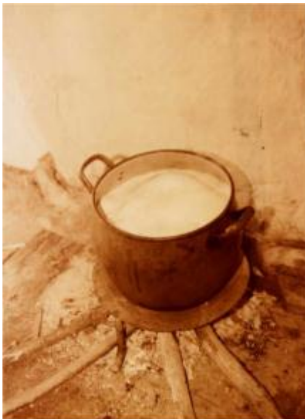
Haciendo queso.

La ensalada de cogollos en ajo blanco y sus huevos por encima.