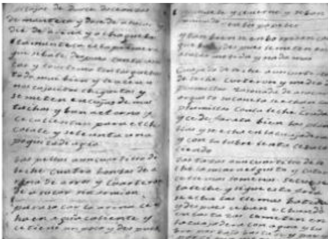
Facsimil del manuscrito encontrado en la calle Málaga de Priego de Córdoba. (Archivo: E.A.O.)

Se trata de un cuaderno de 30 hojas sueltas, tamaño cuartilla, cosidas a mano, por lo tanto, de sesenta páginas, todas ellas escritas. Las hojas que hacen de pastas están muy deterioradas e ilegibles, existiendo pedazos de otras hojas, lo que indica que con el paso del tiempo se han ido perdiendo. Por lo que nos quedamos sin saber el número exacto de páginas y el total de recetas. A pesar de esto, el estado de su conservación, sin ser excelente, es bastante bueno. Toda la letra es la misma, a tinta violeta, excepto en la página 28 de nuestro orden, donde cose con hilo tres octavillas escribiendo en cada una su correspondiente receta. La primera tiene la