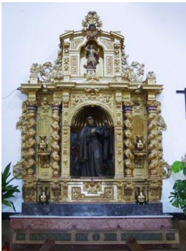
Altar de San Francisco Solano en la iglesia de San Francisco de Priego de Córdoba

* Viaja por última vez a España en compañía de su hija Lisa y de su esposo Caleb.